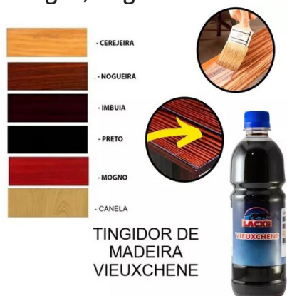
TINGIDOR DE MADEIRA VIEUXCHENE

Vários produtos podem ser utilizados para tingir a madeira. Nas oficinas utilizamos o Vieux Chêne , que é um produto a base de água destinado ao tingimento de madeiras, portas, janelas e móveis. Ele age colorindo, sem retirar as características da madeira. Você pode comprar o pó de Vieux Chêne e diluir com álcool ou água, mas é possível comprar o tingidor já diluído, como utilizamos na oficina. Ele possui várias tonalidades. Na oficina, utilizamos as tonalidades Mogno, Nogueira e Preto .