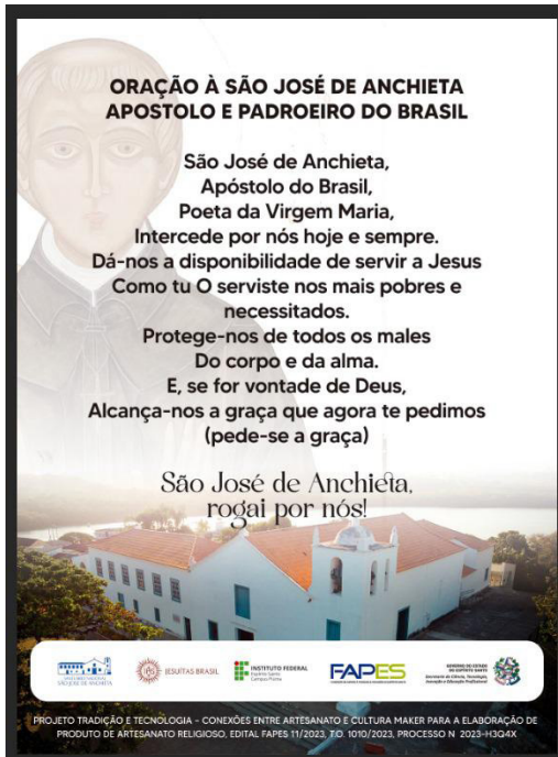
Oração que acompanha as reproduções do ícone