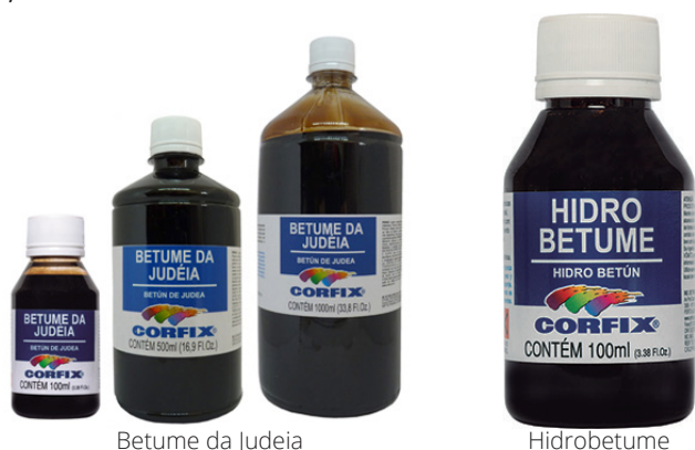
Betume da Judeia

O tingidor de madeira mais utilizado no mundo por artesãs e artesãos que reproduzem ícones é o Betume . Nas nossas oficinas, optamos por utilizar, preferencialmente, materiais a base de água e, por isso, descartamos o Betume. No entanto, uma das participantes nos indicou a utilização de Hidrobetume , que é a base de água. Não fizemos os testes, mas fica a dica.