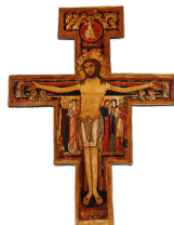
Cruz de São Damião

IMPORTANTE: Para garantir um bom corte com a Lixa 180, a impressão deve ser 1cm maior que o tamanho da madeira na altura e na largura, por exemplo, se sua peça de madeira tem 10cm x 14cm, você deve imprimir uma imagem no tamanho 11cm x 15cm.