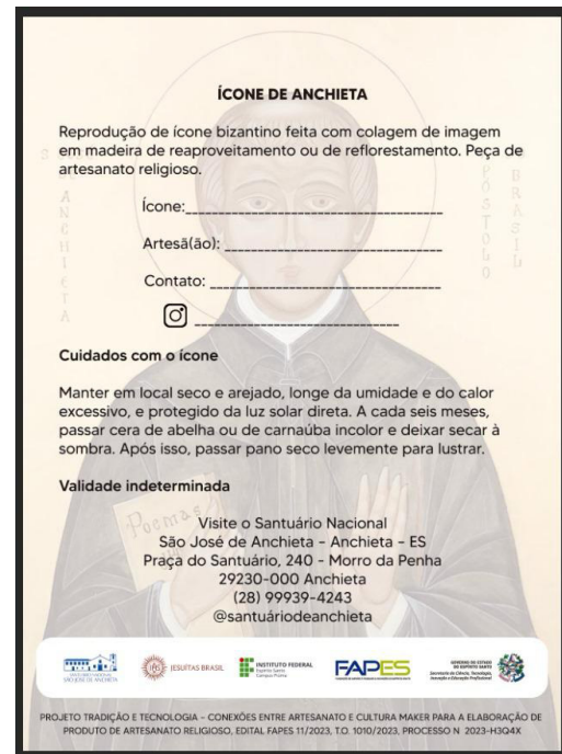
Rótulo da embalagem das reproduções do ícone