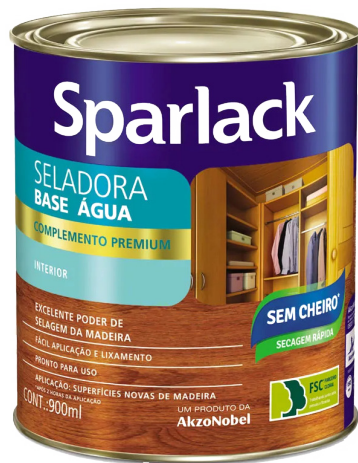
Selador à base de água

Existem diferentes tipos de seladores disponíveis no mercado, incluindo os à base de água, que são opções mais ecológicas e fáceis de limpar. No entanto, também existe os seladores à base de solventes, como aguarrás e thinner. Em nossa oficina usamos um selador industrial a base de água .