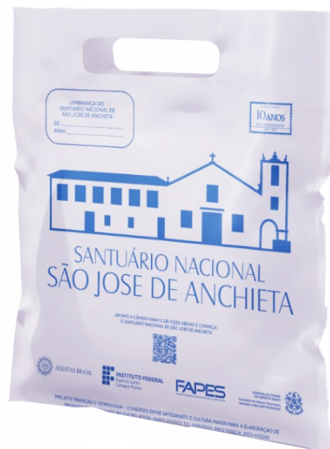
Sacolas para embalagem e divulgação