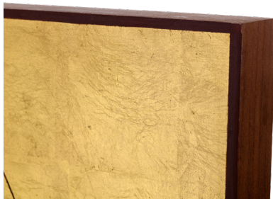
Lateral do ícone de Anchieta

Os ícones são feitos com madeiras ditas amargas (que não atraem os cupins) e resistentes. A madeira mais utilizada é o cedro ( cedrela fissilis e cedrela odorata ), mas dada a escassez no mercado devido a proibição do corte, também se utiliza a Tilia ( Tilia cordata ).