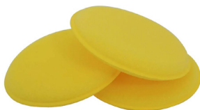
Esponja para aplicação de cera

Se for usar a esponja de pia (verde e amarela), use a parte amarela para passar a cera, mas indicamos tentar conseguir uma esponja mais macia.