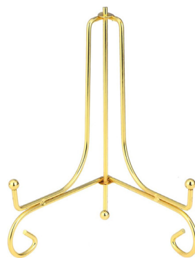
Suporte para pratos

DICA: Ao invés de deixar o ícone na parede ou apenas sustentado pela cavilha, você pode colocar o ícone em um suporte para pratos. Existem diversos modelos, de diversos materiais. Você pode, inclusive, incrementar as vendas oferecendo este produto aos seus clientes. Você mesmo pode criar um modelo de suporte artesanal com madeira ou metal.