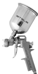
Pistola de pintura

Pistola de pintura - Acabamento profissional, menor tempo de secagem e menor possibilidade de manchar a imagem. Baixo custo se a(o) artesã(ão) já possuir o compressor. É o mais indicado para uma produção em maior escala. Também existem modelos elétricos que atendem aos fins do artesanato em decoupage.