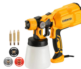
Pistola de Pintura Elétrica

Em todos os casos, é importante conferir, na própria lata do verniz, como deve ser feita a diluição, pois ela depende do tipo de aplicação que será utilizado.